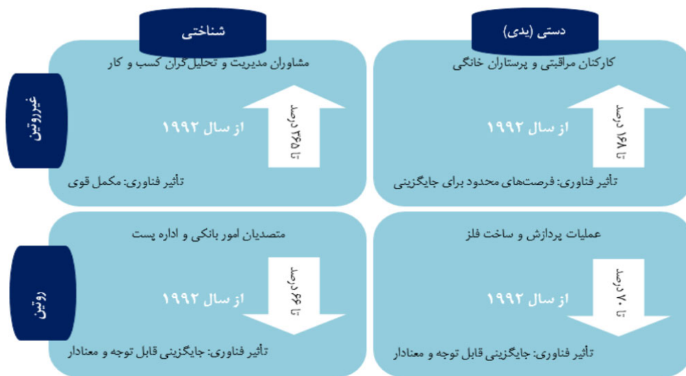
شکل ۲- نمونه‌ای از تأثیر فناوری بر اشتغال بر حسب ویژگی‌های ذاتی مشاغل در انگلستان (استوارت و همکاران، ۲۰۱۵ به نقل از: هاشمی و همکاران، ۱۳۹۷)

مروری بر وضعیت اشتغال در حوزه کشاورزی نشان می‌دهد انقلاب‌های صنعتی و در واقع، فناوری اطلاعات، سبب کاهش اشتغال در مشاغلی شده که به نیروی دستی و فیزیکی احتیاج دارند. در واقع، عصر اول ماشینی‌شدن، جایگزینی ماشین بجای انسان است. در سال ۱۸۷۱، ۶/۶ درصد از شاغلین در انگلستان در حوزه کشاورزی مشغول به کار بودند. این سهم در سال ۱۹۹۰ به ۰/۴ درصد و در ۲۰۱۱ به ۰/۲ درصد رسید که کاهش ۹۵ درصدی تعداد شاغلین این بخش در این بازه زمانی را به همراه داشت.