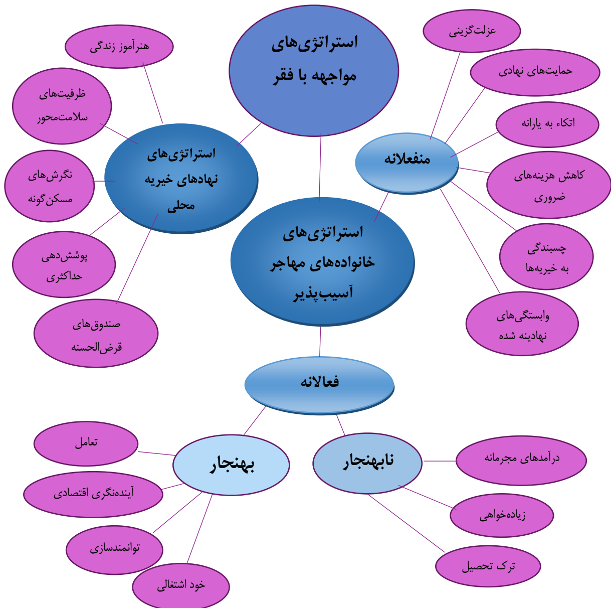
شکل ۱- شبکه مضامین استراتژی‌های مواجهه با فقر در خانواده‌های آسیب‌دیده محله دهونک و نهادهای خیریه محلی

"این محله کوچک، همه‌همدیگر را می‌شناسند، ما کلاس‌های آموزشی مختلفی داریم، هزینه‌ای ندارد، مردم بخصوص خانم‌ها و جوانان استقبال می‌کنند، چون قیمت این کلاس‌ها در بیرون گرانه و نمی‌توانند از عهده آن بربایند."